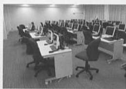
イングリッシュルーム