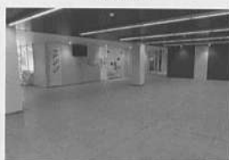
中央棟エントランス(売店:中央奥)